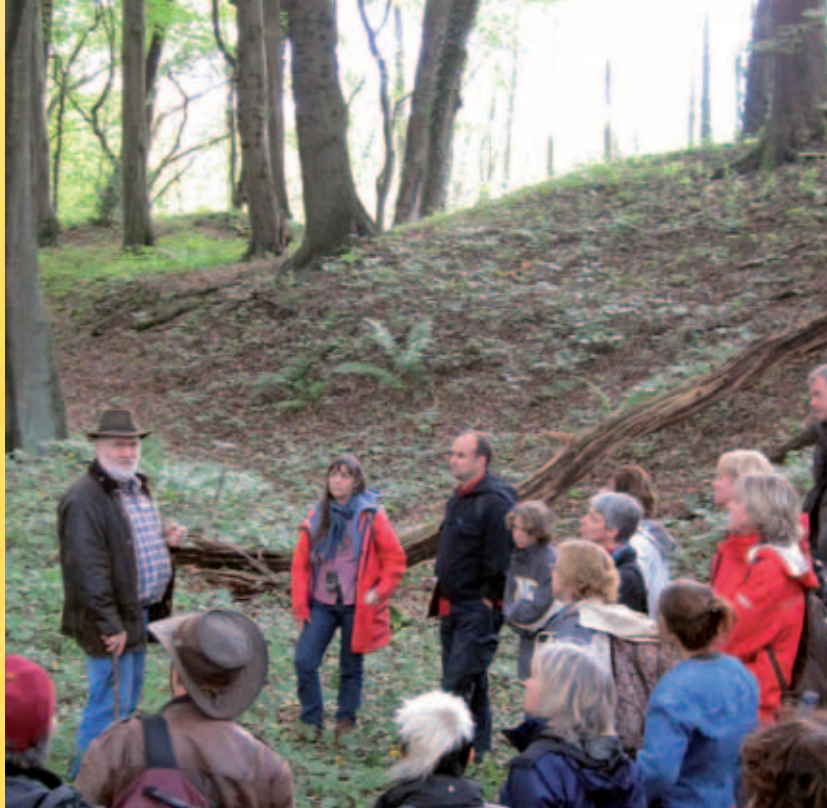
Wo die Kronen der Buchen zum Dach einer alten Burg werden vereinen sich Natur, Geschichte und Mythen

Eine Gruppe von Menschen mit unterschiedlichen Erfahrungsbiografien aus allen Generationen bieten unter dem Dach der Wupper-Tells vielfältige